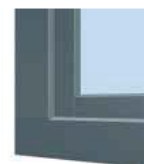
Moderne Optik mit stumpf gestoßener Aluminium-Vorsatzschale